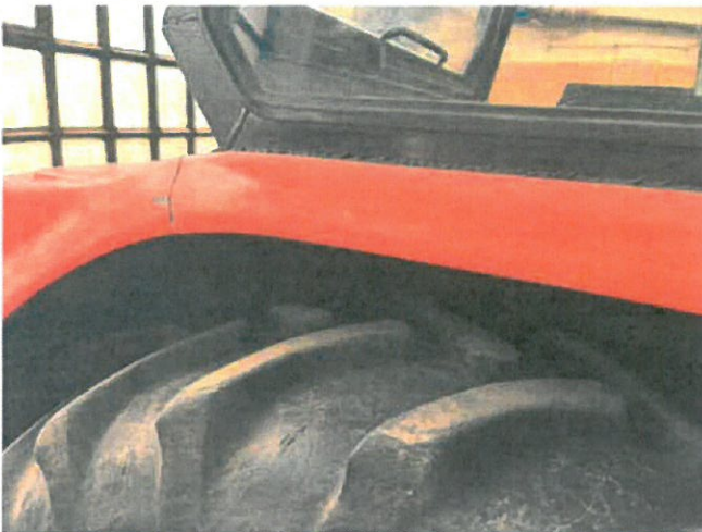
Fot. 15 IMG_6875